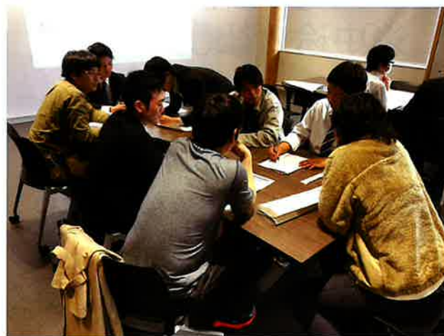
写真2：グループ実習の様子