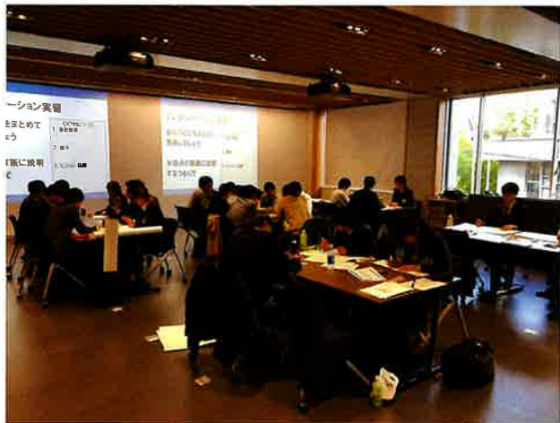
写真1：研修会場の様子